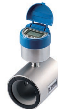
電磁式 水道メーター SU