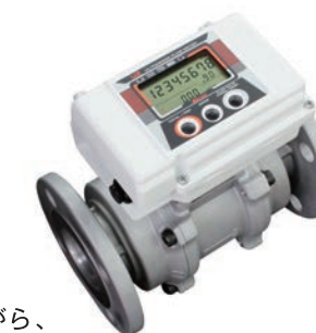
燃料ガス管理用 超音波流量計 UZ